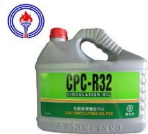
圖 1：中油 R32 特級循環機油

久順餐飲設備有限公司 http://www.jeoushun.com/ 客服專線 0800-225222 客服手機 0925-225222 客服傳真 0800-025666